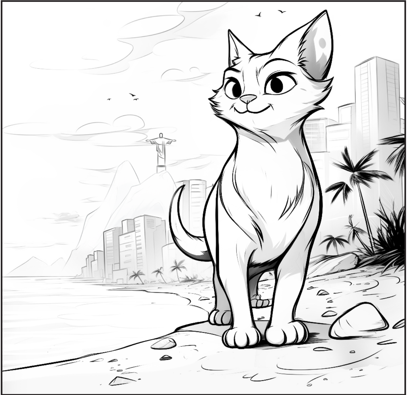
Ρίο ντε Τζανέιρο _ Βραζιλία