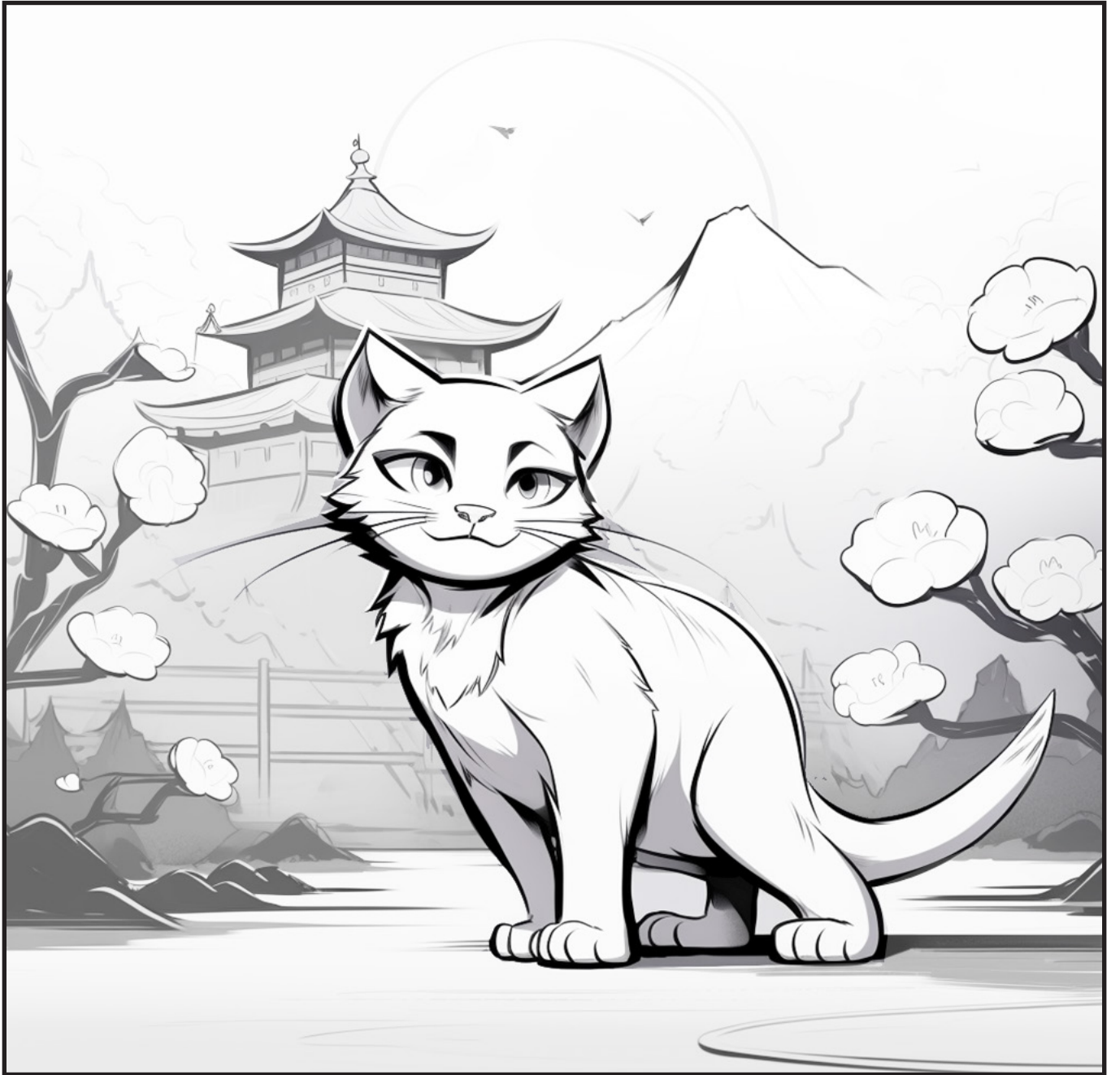
Κιότο _ Ιαπωνία