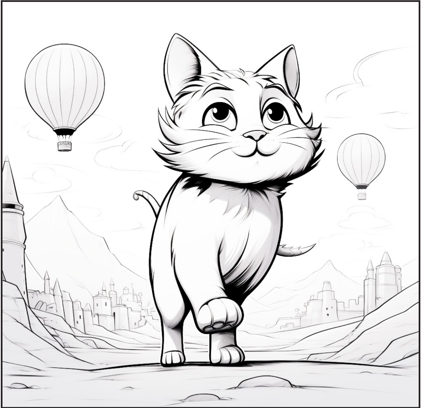
Καππαδοκία _ Τουρκία